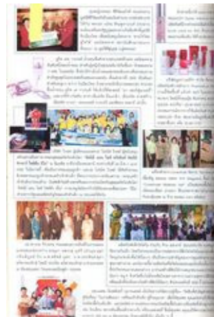
Page for PR