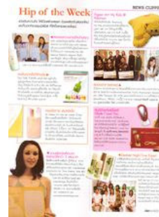
Page for PR